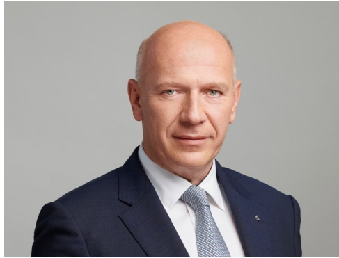
Kai Wegner